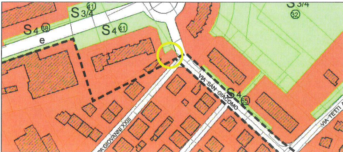
PROPOSTA MODIFICA P.R.G.C. - scala 1:2000 Estensione perimetrazione area normativa Rb - superficie interna alla proprietà